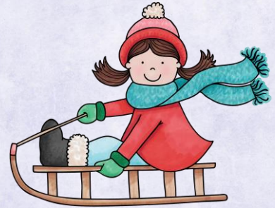
Abb.: © Kudryashka - fotolia | © tilde-edition.de