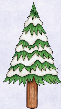
Abb.: © Kate Hadfield Designs | © tilde-edition.de