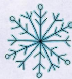
Abb.: © Kudryashka - fotolia | © tilde-edition.de