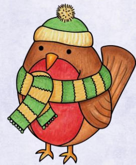
Abb.: © Kate Hadfield Designs | © tilde-edition.de