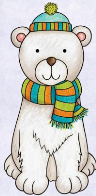
Abb.: © Kate Hadfield Designs | © tilde-edition.de