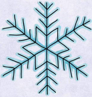
Abb.: © Kudryashka - fotolia | © tilde-edition.de