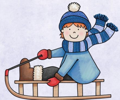
Abb.: © Kudryashka - fotolia | © tilde-edition.de