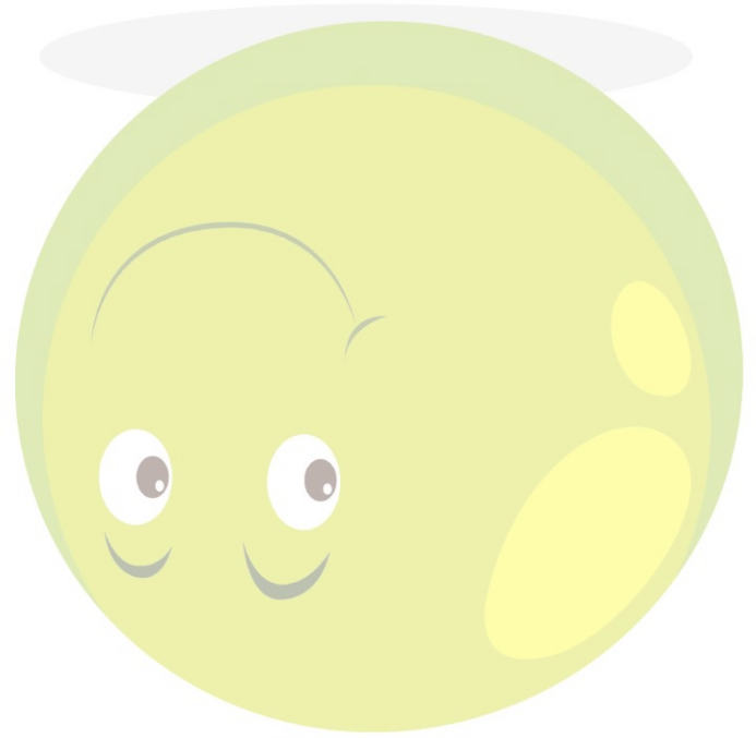
Abb.: © bluringmedia – fotolia