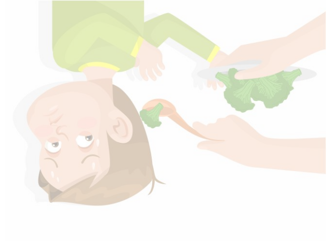
Abb.: © bluringmedia | © PrettyVectors - fotolia