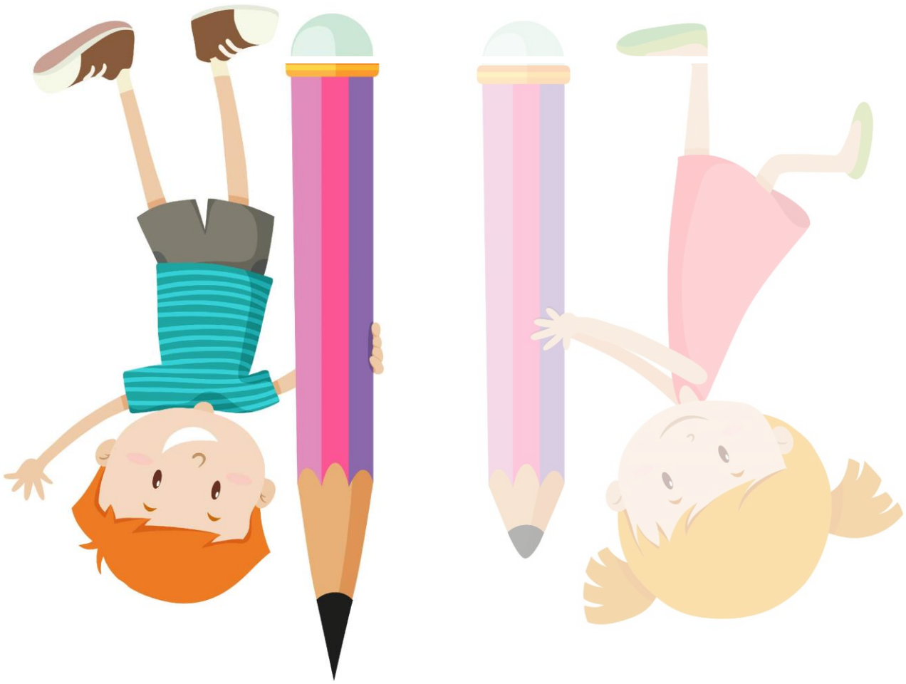
Abb.: © bluringmedia - fotolia