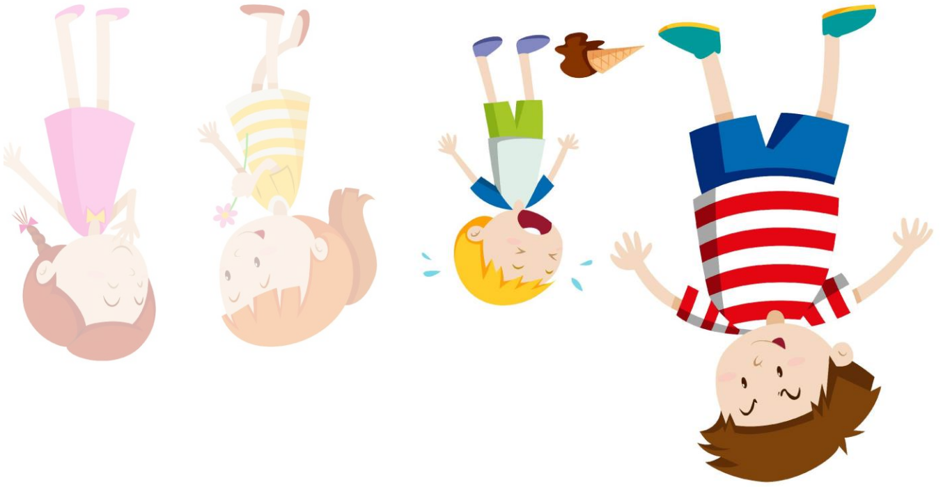
Abb.: © bluringmedia – fotolia