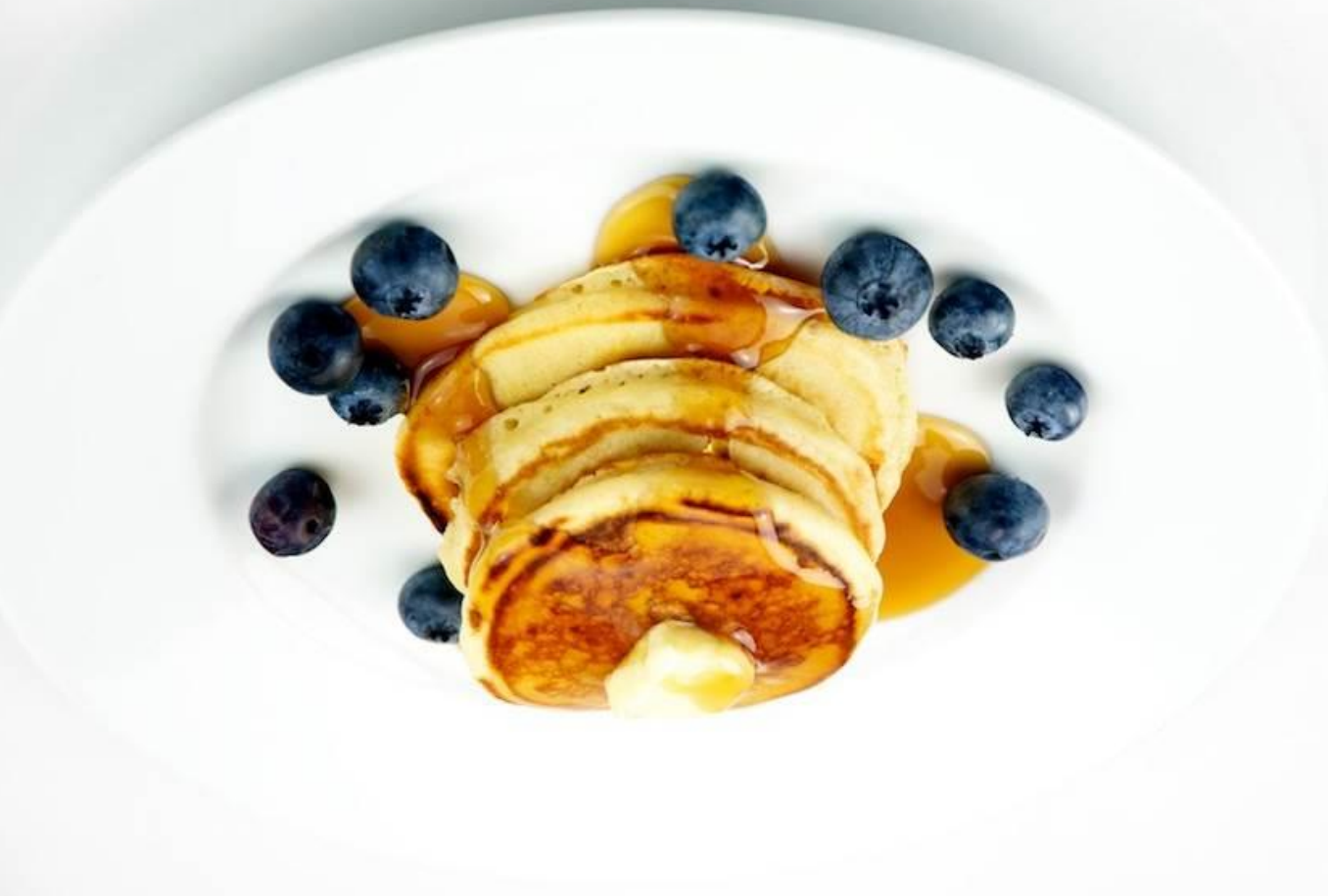
Abb.: © The Culinary Geek