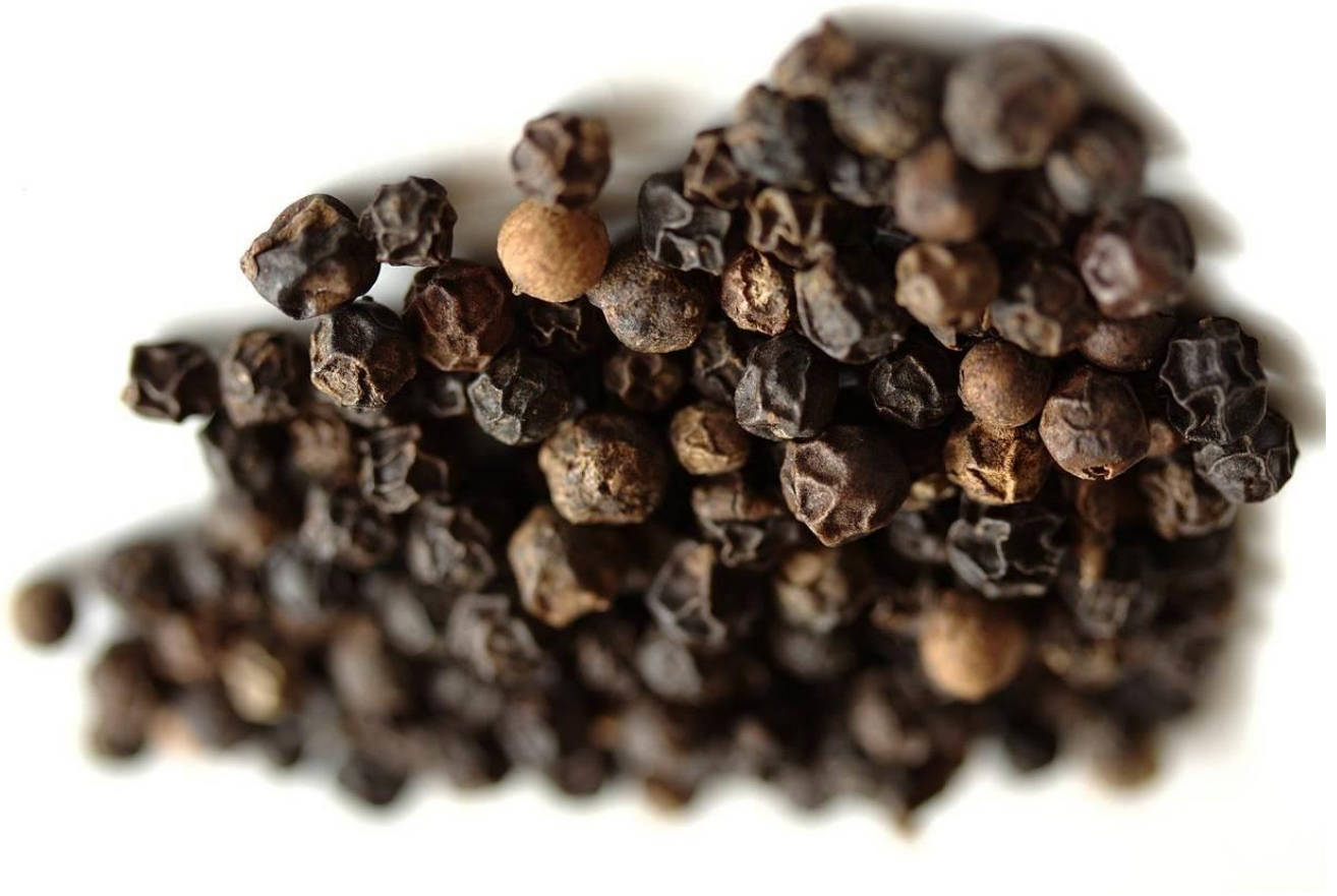
Abb.: public domain