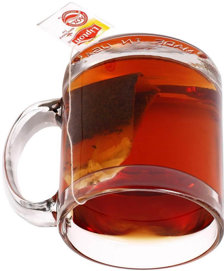
Abb.: public domain