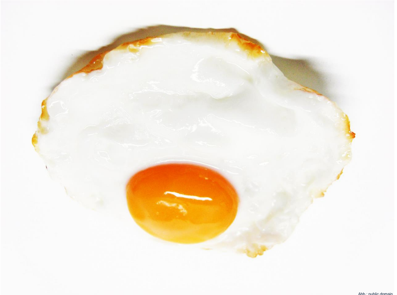
Abb.: public domain