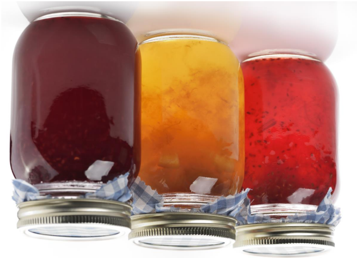
Abb.: © SunnyS - Fotolia.com