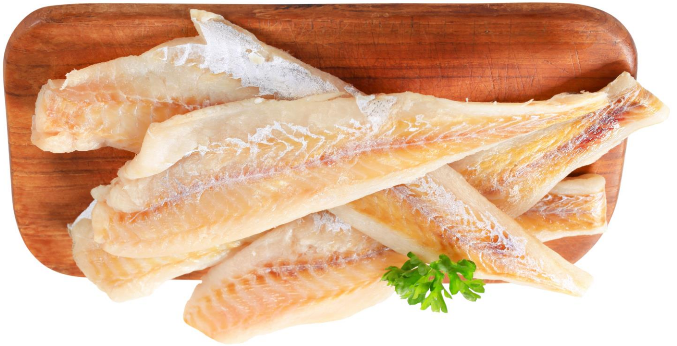
Abb.: © Viktor - Fotolia.com