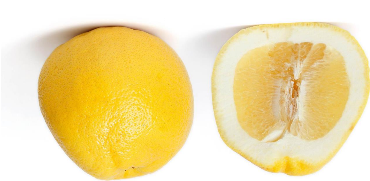
Abb.: © Fir0002-Flagstaffotos