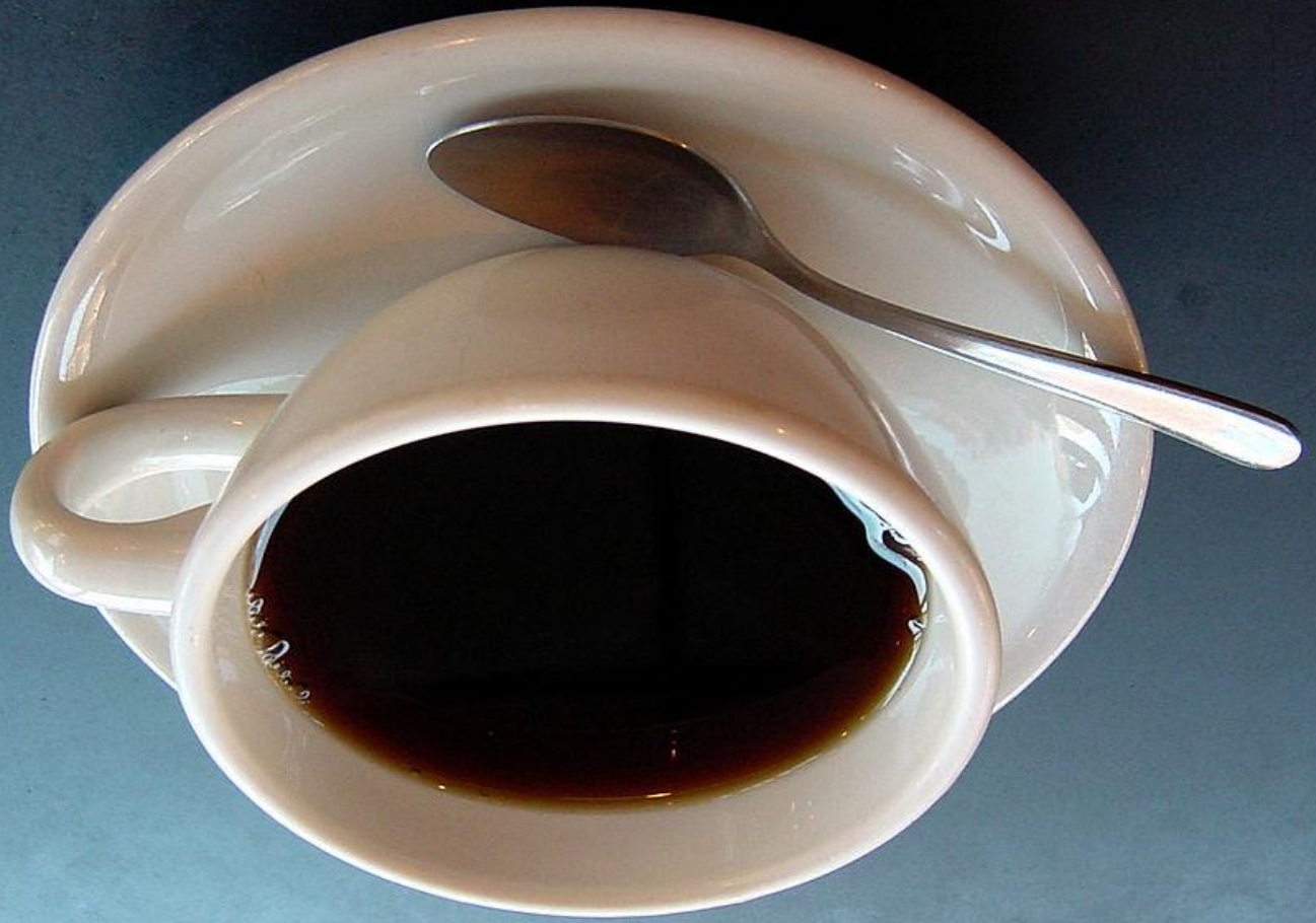
Abb.: © Julius Schorzmann