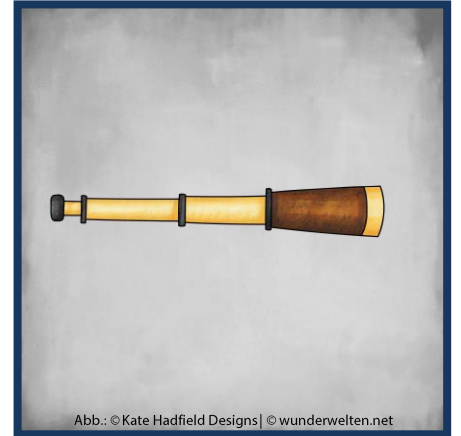
Abb.: © Kate Hadfield Designs | © wunderwelten.net

Pirat Kim bewahrt seine Goldmünzen in einem Säckchen auf.