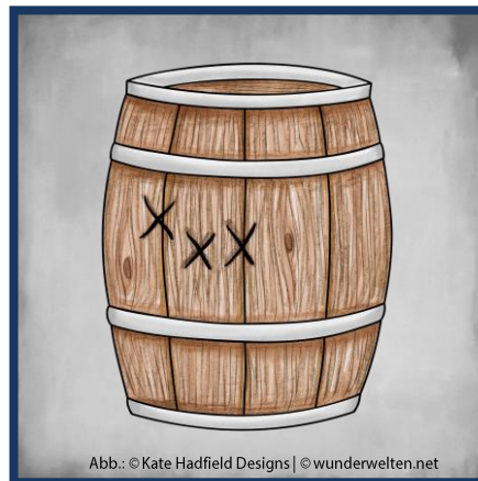
Abb.: © Kate Hadfield Designs | © wunderwelten.net

Große Mengen Gold und Edelsteine lagern die Piraten in der Schatzkiste.