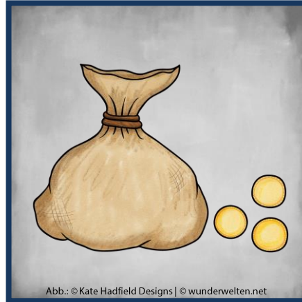
Abb.: © Kate Hadfield Designs | © wunderwelten.net

Auf langen Reisen trinken Piraten oft Rum statt Wasser. Rum bleibt auch in der Hitze keimfrei.