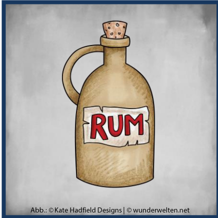
Abb.: © Kate Hadfield Designs | © wunderwelten.net

Auf langen Reisen trinken Piraten oft Rum statt Wasser. Rum bleibt auch in der Hitze keimfrei.